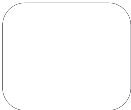
EXTRA WHITE 11045